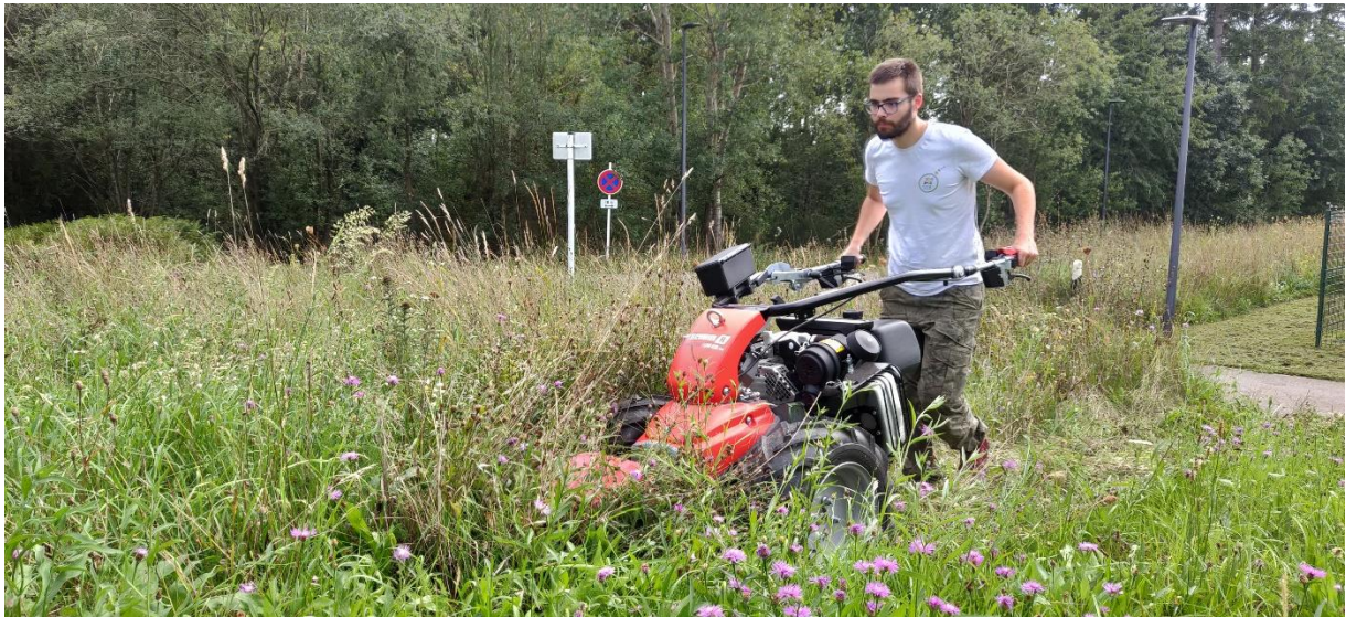
Beschreibung: Balkenmäher am Asaz.

Méimethod. Wéi uewen ugedeit ass d'Méimethod och e wichtege Faktor. Bei de wuel gängegste Méimaschinnen am Privatberäich, déi sougenannt Mulcher (d.h. Sichelmulcher, och "Mulchrasenmäher" genannt, a Schlegelmulcher) ginn déi meescht Insekten, déi sech an der Fuerspuer befannen, ugesaugt a futti gemaach. Fir dësem Effekt entgéintzewierken, kann een d'Schnëthéicht op de Maximum astellen (oder sou wäit vergréissere, wéi d'Notzung et zouléist). Méi insekteschouend Méigeschier sinn zum Beispill e "Balkenmäher", e "Freischneider" mat "Dreiecksmesser"- oder "Kreuzschere"-Opsaz oder eng Séissel.